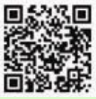
▲羽村市 小口零細企業資金融資制度