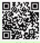
▲羽村市 中小企業資金融資制度