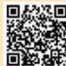
▲羽村市生産性向上事業助成金

コロナ禍を乗り越えるため、業務効率化など操業環境向上の取組みを行った市内事業者に対し、設備導入などに係る経費の一部を助成します。