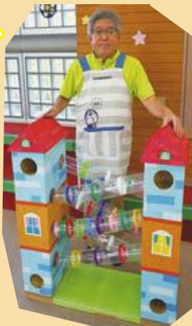
▲段ボールとペットボトルで作った「コロコロタワー」

今回紹介したのは、どれもみんなの周りにあるものを使って作ったんだ。自然のものだから、まっすぐとか、大きさがそろうなんてことはないけれど、そこは臨機応変に考えて楽しもう。ちよっと工夫すると、とっても面白いものができるよ！みんなもぜひチャレンジしてね！