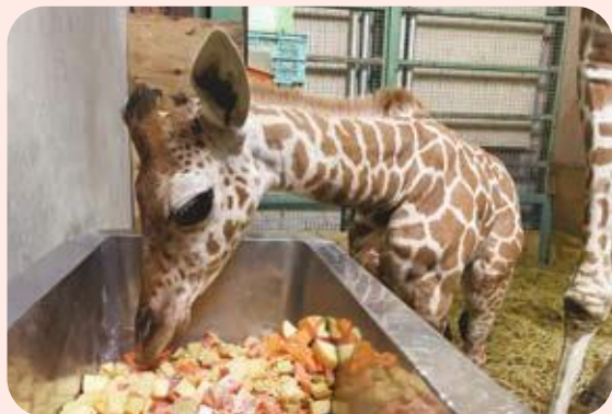
▲ごはんは小さく切ってもらっています。

※新型コロナウイルス感染症の感染拡大防止のため、開園状況が変更になる場合があります。