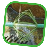
▲「草の水車」 松葉で作ったもの。 水を当てるとグルグル回るよ！