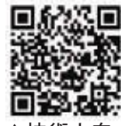
▲技術力向上及び人材育成支援助成金

市内の中小企業者が技術力向上および人材育成のために要した講習会の受講料や資格取得の費用について、企業者が負担した経費の2分の1(上限20万円)の額を助成します。