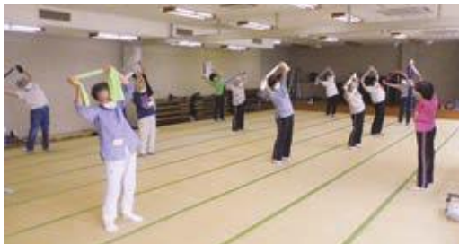
▲まいまいず健康教室の様子

介護予防リーダーは、高齢の方を対象とした健康体操教室「まいまいず健康教室」を支えるボランティアです。経験は不要で、どなたでも受講できます。