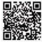
▲中小企業販路開拓支援助成金

市内中小企業者の新たな販路開拓を支援するため、展示会や見本市への出展料、自社の製品・技術などの販売促進に係る費用のほか、ウェブサイトの新規作成や大幅改修などの経費について、助成対象経費の2分の1(本助成金を初めて利用する方は3分の2、いずれも上限10万円)を助成します。