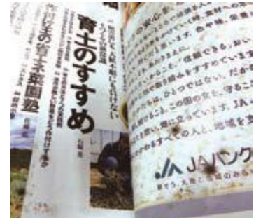
▲カビの生えた雑誌