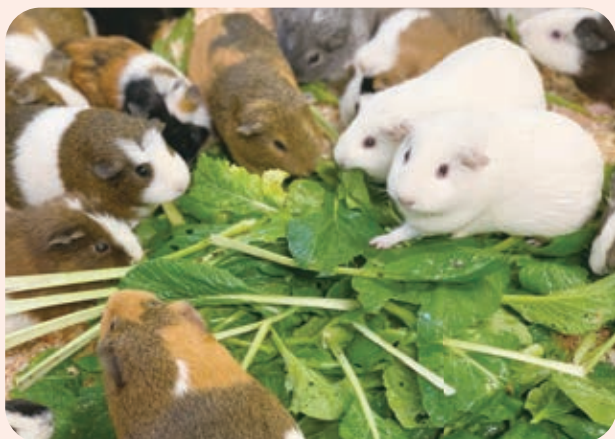
▲おいしい小松菜に大興奮のモルモット