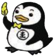
▲更生ペンギンのホゴちゃん