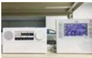
▲防災行政無線戸別受信機(左)と文字表示装置