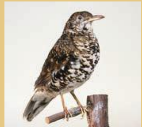
▲トラツグミの剥製。郷土博物館の常設展示室で展示しています。