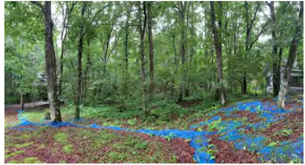
写真手前の青いシートは隣地、建物の敷地として利用されている