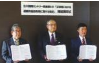
▲(左から)橋本市長、立川国際カントリー倶楽部榎本支配人、あきる野市の村木市長