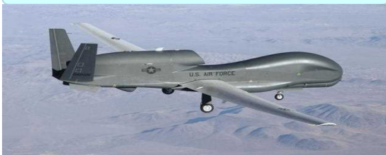
グローバル・ホーク(RQ-4)