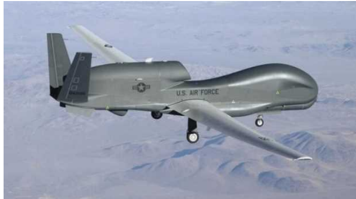
RQ-4B (グローバルホーク)