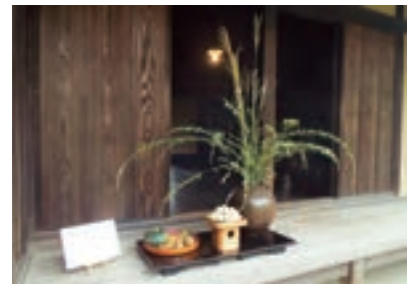
▲昨年のお月見かざり

日 9月3日(土)〜11日(日)の午前9時〜午後5時(旧下田家住宅は午後4時まで) 会 オリエンテーションホール、旧下田家住宅