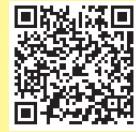
▲気象庁天気 予報サービス

※ほかにも「東京アメッシュ」「国土交通省防災情報センター」「国土交通省京浜河川事務所」「東京都水防災総合情報システム」などのウェブサイトから気象・河川情報を収集することができます。