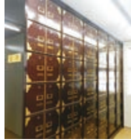
▲合葬式墓地(納骨壇)

※区画墓地では墓石のデザインは自由ですが、墓碑の高さ(2m以内)などの制限があります。また、毎年、霊園管理料がかかります。 ※合葬式墓地(合葬室)は、通年で募集を行っています。