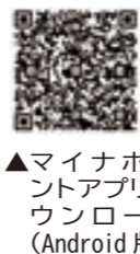
▲マイナポイントダウンロード(Android版)