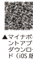
▲マイナポイントダウンロード(iOS版)

「マイナポイントアプリ」から申し込むことができます。アプリは左の二次元コードからダウンロードすることができます。 ※一部対応しないスマートフォンがあります。 ※1台のスマートフォンで複数の方の申込みができます。