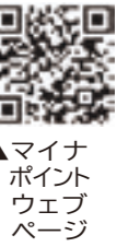
▲マイナポイントウェブサイト

令和4年9月末までにマイナンバーカードの申請をした方を対象に、「マイナポイント第2弾」が申し込めるようになりました。