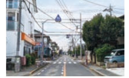
▲羽村富士見郵便局前交差点

羽村市五ノ神2丁目8番地先の羽村富士見郵便局前の交差点は、優先道路が変更されたことに伴い、一時停止標識の位置が変わりました。 通行の際は、道路標識をよく確認の上、安全運転に努めるようお願いいたします。