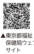
▲東京都福祉保健局ウェブサイト