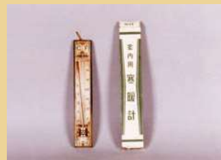
▲【右】外箱 【左】寒暖計本体(摂氏と華氏表記)