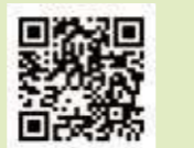
▲プリモホールゆとろぎ公式 Instagram

プリモホールゆとろぎのイベント情報などを発信していきます。ぜひフォローをお願いします！