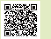
▲プリモホールゆとろぎ公式 Twitter