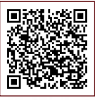
羽村市公式サイト (ゆとろぎ)

発行 羽村市教育委員会 編集 羽村市生涯学習部生涯学習推進課 羽村市生涯学習センターゆとろぎ協働事業運営市民の会