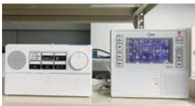
▲防災行政無線戸別受信機（左）と文字表示装置

状況により、施設が休館したり、事業などが変更・延期・中止になる場合があります。最新情報は、市公式サイト・各施設のウェブサイトなどで確認してください。