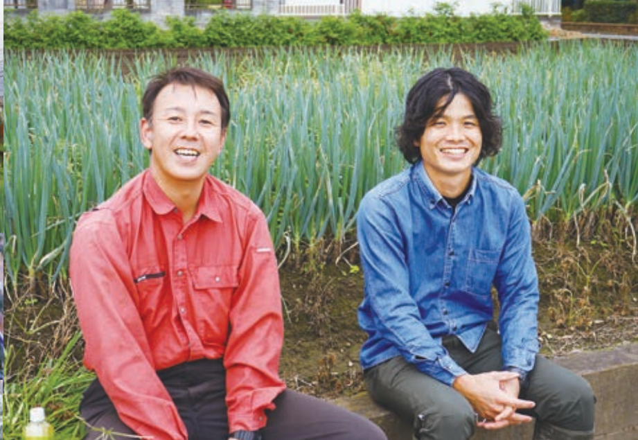
▲インタビューの合間にざっくばらんに話していた2人。農家は日頃から交流があり、それぞれの畑や農作物などについてもよく知っている。