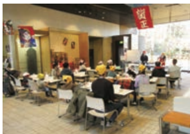
▲昨年度の体験学習会の様子

会 オリエンテーションホール、旧下田家住宅 対 市内在住・在勤の方(小学生以下は保護者同伴) 定 15人(申込順) 持 エブ