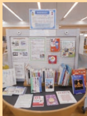
▲昨年の展示の様子

障害者週間に合わせて、館内で、障害について理解が深まる図書や、活字による読書が困難な方のための資料を展示します。