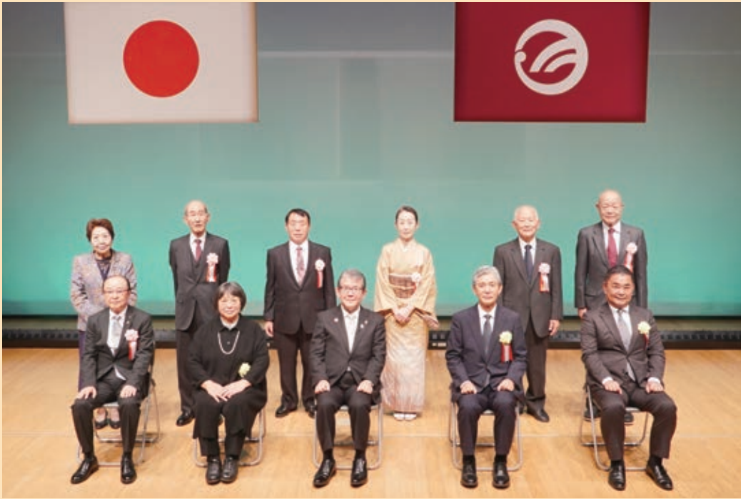
▲自治功労者等表彰受賞者と橋本市長