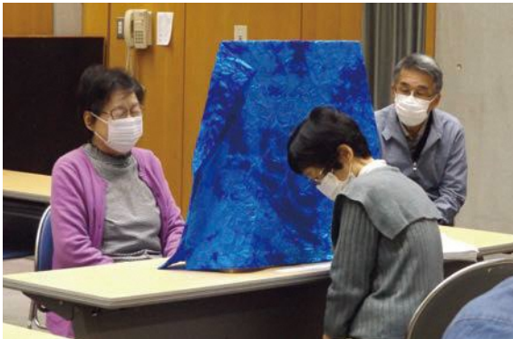
▲会員が作成した事例をもとに、話し手、聞き手、観察者に分かれてロールプレイを行い、スキルアップを図っています。