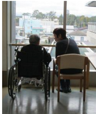
▲コロナ禍前は施設での傾聴活動も行っていました。

「糸でんわ」は、話を聴いてほしいと思っている人の気持ちに寄り添い、受け止め、お話を伺う、お話し相手ボランティアです。会員は「相手のお話を否定や反論せずに、ありのままをきちんと受け止めて聴く」という傾聴のトレーニングを積んでおられ、活動を始めて17年目になります。