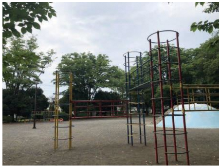
指定管理者が管理運営していく市内公園のひとつ

A 引き続き公園行政を行っていく。指定管理者制度を行うことで、職員の現場作業が軽減し、公園の在り方など、管理計画などに集中した業務となる。