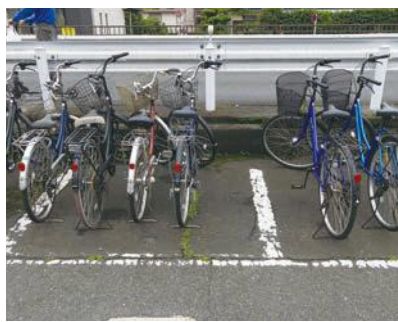
羽村駅東口第4自転車駐り場

質問 福生市は、平成10年に有料化したのが、利用者が減り、事業者への委託料を増やさざるを得なくなった。その結果、公費負担は、有料化前より増えてしまった。この事態をどう考えるか。 市長 詳細を把握していないので、答えられない。