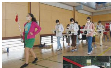
◀行進の練習も行います