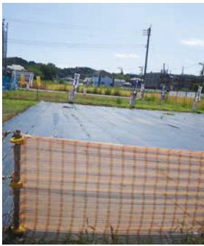
優先整備地区の羽村大橋からの3・4・12号線予定地

市長 心身や生活面の安定を図ることが大切であり、関係機関が連携し心身の安定に向けた支援やサービス内容の再検討など対応が図られている。