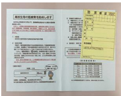
高校生等医療費助成制度で使用するマル青医療証

に応じて、介護タクシーや社会福祉協議会が運行する「ふれあいキャリア」などの利用が考えられる。市は「ふれあいキャリア」の運行に際し、助成を行っている。