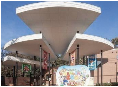
ヒノトントンZOO(羽村市動物公園) エントランス