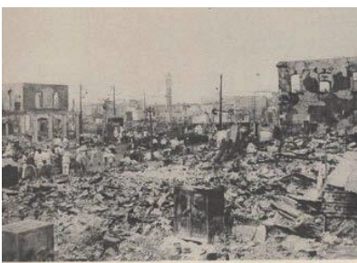
関東大震災の惨状。銀座四丁目付近

教育長 「熱中症対策ガイドライン」に則り、各学校の校内研修等で全教職員に共有している。