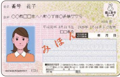
マイナンバーカードの見本