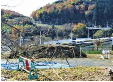
施工期間が2024年度までの、羽村大橋からの都道3・4・12号線予定地