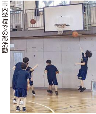
市内学校での部活動

市長 空き家対策に精通した民間事業者の活用等、効果的・効率的な手法も検討し、適切な管理を促進するための体制整備を検討する。