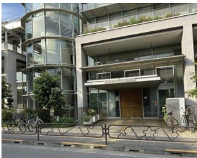
プリモライブラリーはむら(羽村市図書館)

市長 移転交渉過程での協議の中で、様々な要望や、時には厳しい意見をいただいている。改めて特別な機会を設け、意見聴取を行う考えはない。