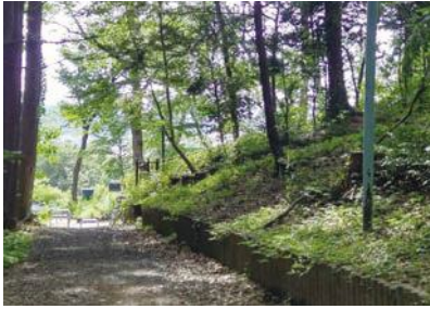
増設を望む声の多い場所へ防犯カメラの設置を