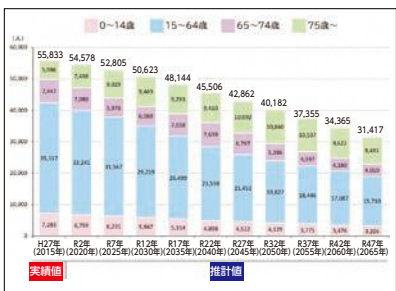
羽村市の将来人口推計(第六次羽村市長期総合計画より)

教育長 過去の取組みを生かしてマニュアルを作成し、市内全校に配布した。また、情報教育推進委員会、情報活用能力の育成の在り方を協議の上、カリキュラム等を作成し、各学校で活用している。