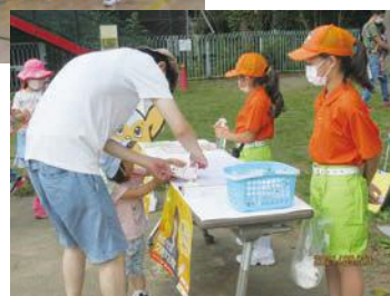
▶演奏だけでなく、交通安全週間のイベントにも参加しています

奏活動や遠足などを再開し、交通安全について学ぶ機会を設けるなど、活動を充実させていきたいです。