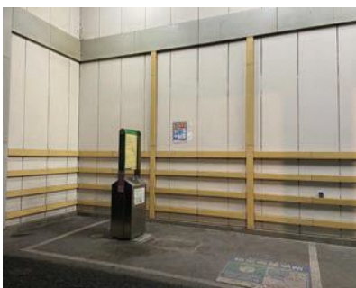
羽村駅西口喫煙所

社を訪問し、設置について要望している。また、東京都市長会を通じ、都に対して要望を行っている。今後とも関係自治体と連携して働きかけていく。