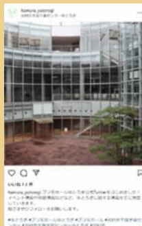
プリモホールゆとろぎ公式 Instagram