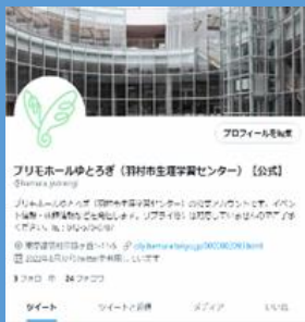
プリモホールゆとろぎ公式 Twitter

ゆとろぎ公式 SNS (Twitter、Instagram) ではゆとろぎについての情報を定期的に発信しているよ！是非みんなフォローしてみるりん！