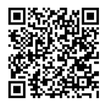
▲体育協会ウェブサイト

報はむら1月15日号を確認してください。 ※コース周辺に路上駐車などをしてください。 問 NPO法人羽村市体育協会 ☎ 555-1698 ▲体育協会ウェブサイト