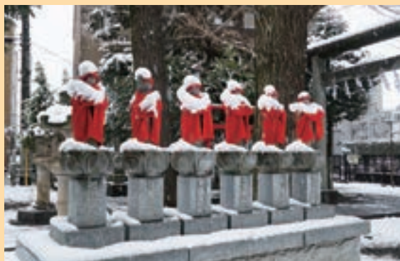
南岸低気圧の影響で関東甲信地方で降雪（2月10日撮影）

状況により施設が休館したり事業が変更・中止になる場合があります。最新情報は市公式サイト・各施設のウェブサイトなどを確認するか、問い合わせてください。