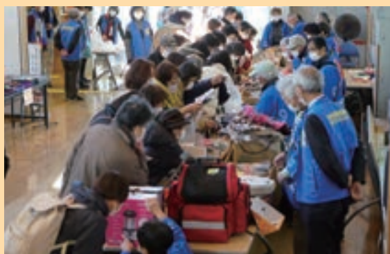
令和4年度はむらふれあい福祉バザー（2月26日撮影）

2月4日～3月5日に郷土博物館で行われた「ひな人形展」。おなじみの内裏びなのほか、江戸時代の立ちびなや、昭和30～40年代に流行した御殿びな、15人揃えに調度品を加えた段かざりが展示されました。