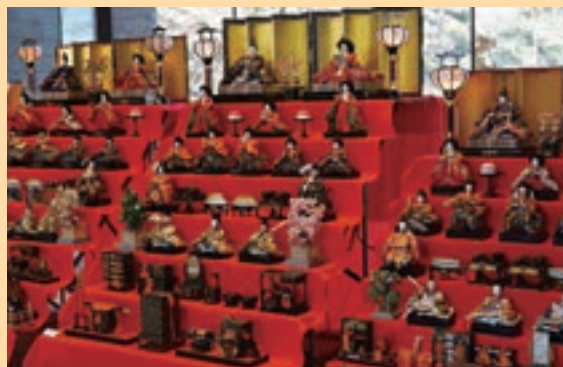
郷土博物館でひな人形を展示（2月26日撮影）

2月4日～3月5日に郷土博物館で行われた「ひな人形展」。おなじみの内裏びなのほか、江戸時代の立ちびなや、昭和30～40年代に流行した御殿びな、15人揃えに調度品を加えた段かざりが展示されました。