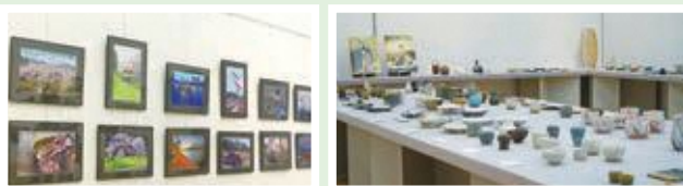
▲見応えのある作品が並びます

文化協会に加盟している団体の作品を発表する美術・工芸展（写真は陶芸・木工の部と写真の部）。ほかにも書道や水墨画など、5期に分けて、6月18日(日)まで展示します。詳しくは文化協会へ。☎579-2772