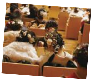
令和5年二十歳のつどいスタッフの皆さん▼