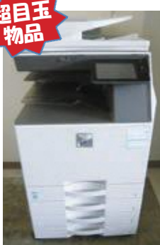
▲フルカラーデジタル複合機（SHARP 製 MX-2630 / 基本機能のみ / 予定見積価格：約24万円）