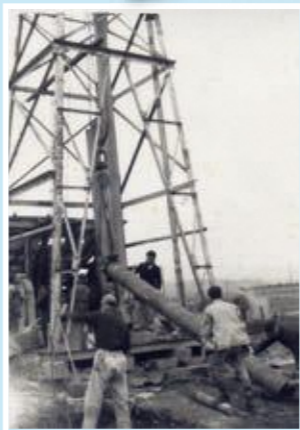
◀昭和34年。第1号の井戸（深井戸）を削井している様子。現在の水道事務所内。