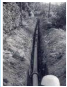
昭和36年の配水管布設 工事の記録から▶