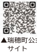
▲瑞穂町公式 サイト