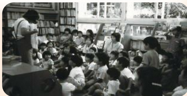
▲旧館でのおはなし会。親子コーナーが満員になるほどでした。

今よりも放課後の過ごし方の選択肢が少なかった時代です。図書館や分室には大勢の子どもたちが本を借りに来ました。おはなし会も大人気で、たくさん子どもたちが読み聞かせを楽しみました。