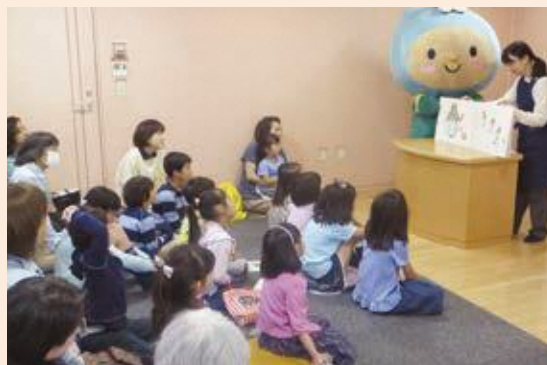
◀現在のおはなし会。子どもたちの熱心な表情は昔と変わりません。