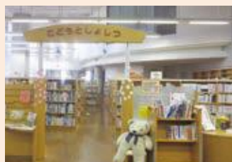
▲現在の子ども図書室。大きなクマのぬいぐるみが子どもたちをお出迎え。