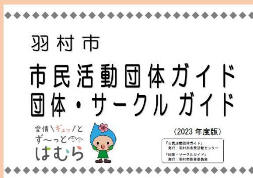
▲表紙サンプル画像

これから何かを始めたい、学びたい、参加したいと思っている方は是非御活用ください！