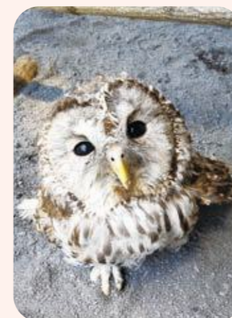
▲保護されたばかりの時のあずきちゃん

昨年10月に八王子市内で保護されたホンドフクロウのあずきちゃん。東京都環境局の依頼を受け、新たに5月からヒノトントンZOOに仲間入りしました。保護するときに羽をカットしているため今は少し短くなっていますが、ゆっくりときれいな羽に生え変わりつつあります。早く上手に飛べるように見守ってください。