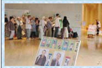
芸術鑑賞部会「ゆとろぎ寄席」 いつも笑いがいっぱい!