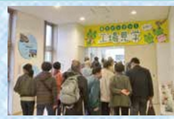
学習文化部会「工場見学」 大盛況! 大満足!