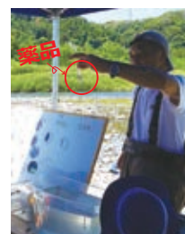
▲薬品で水質を検査