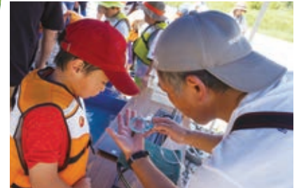
◀こんなの採れた！(カジカです)