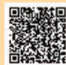
▲電子証明書搭載サービス