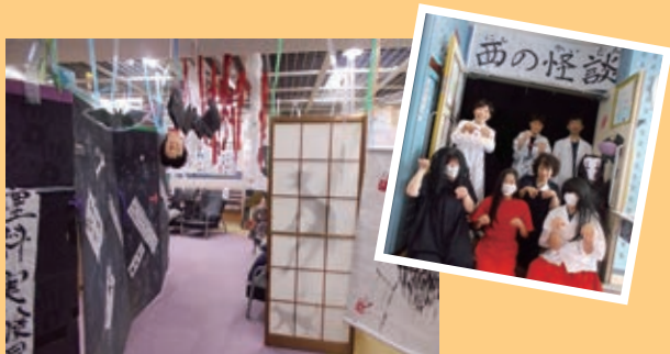
西の怪談～ちょっと怖い体験をして みよう (7月15日撮影)

西児童館では、今年も2階のプレイルーム を使ってお化け屋敷を行いました。 その名も「妖怪まつり」。スタッフが最恐の 姿で2日間で85人の参加者をおどかしました。