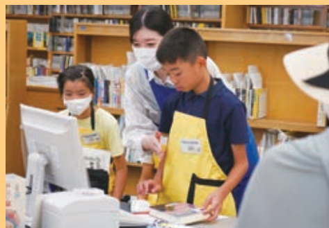
夏休み司書体験 (7月26日撮影)

プリモライブラリーはむらで行った「夏休 み司書体験」には、市内の小学生8人が参加 しました。カウンターでの本の貸出し・返却 の仕事など、図書館の仕事についていろいろ 学びました。