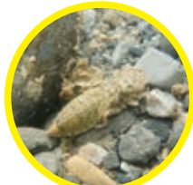
▲きれいな川に多いオナガサナエ(トンボ)の幼虫を発見！