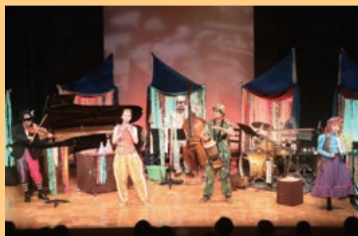
東京都・羽村市連携企画 ワークショップコンサート バーバラの魔法のくすり (7月30日撮影)