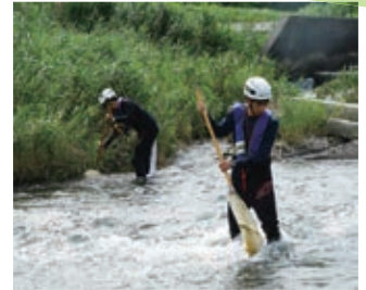
▲今回は2か所で生き物を採取