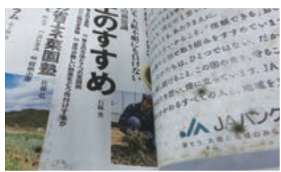
▲カビが生え汚れてしまった本

図書館資料の水ぬれや汚れの付着が相次いでいます。水ぬれは放っておくとページに歪みが生じたり、ページがくっついてしまったり、ひどい場合にはカビが生えてしまいます。水筒やペットボトルの結露で濡れてしまうこともありますので、図書館の資料が濡れないよう、持ち歩く時はビニール袋に入れるなどの配慮をお願いします。汚れが付着し、ほかの利用者に提供できなくなった資料もあります。また、たばこなどのにおいの染みつきも最近多く見られます。状態がひどい場合には弁償していただくこともありますので、ご注意ください。図書館の資料は市民共有のもので、大切に扱ってください。