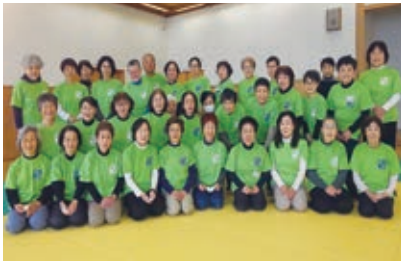
▲介護予防リーダーの皆さん