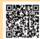
▲引っ越し手続きオンラインサービス