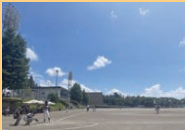
▲8月6日子どもたちは野球で交流(原っぱ野球大会)