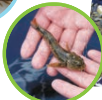
▲カジカもきれいな川に棲む生き物