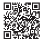
▲観光協会ウェブサイト

申・問 9月1日(金)までの午前9時～午後5時に、電話または直接、羽村市観光協会へ ☎ 555-9667 (8月中は土・日曜日休み) ▲ 観光協会ウェブサイト