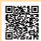
▲引っ越し手続きについて