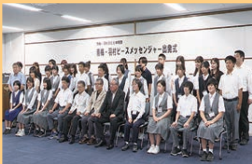
青梅・羽村ピースメッセンジャー出発式 (7月28日撮影)

プリモライブラリーはむらで行った「夏休 み司書体験」には、市内の小学生8人が参加 しました。カウンターでの本の貸出し・返却 の仕事など、図書館の仕事についていろいろ 学びました。