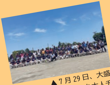
▲7月29日、大盛り上がりだった大人チーム