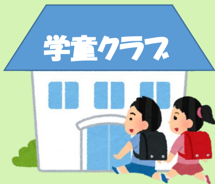
施設配置図（富士見小学校内）