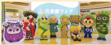
▲8市町村の公式キャラクター

西多摩地域8市町村(羽村市、青梅市、福生市、あきる野市、瑞穂町、日の出町、檜原村、奥多摩町)が一体となって、西多摩の魅力を発信する「西多摩フェア」。当日は、観光情報PR、特産品販売、VR体験(予定)のほか、8市町村の公式キャラクターも大集合します。ぜひ遊びに来てください。