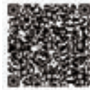
▲電子申請サービス