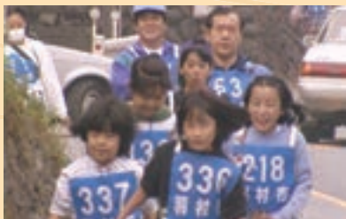
▲羽村御岳完歩大会にも同行しました。