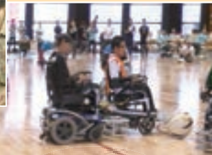
◀障害者スポーツ・レクリエーションのつどい