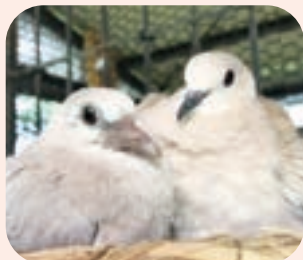
▲今年産まれた雛と母親