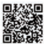
▲胃がん・肺がん検診