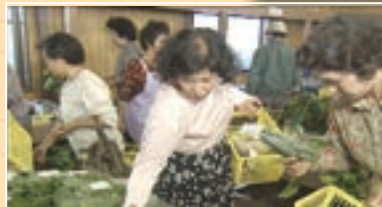
▲農産物直売所オープンにお客様が殺到した様子も、ニュースになりました。