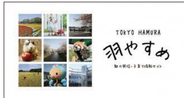
▲「羽やすめ」のメインビジュアル