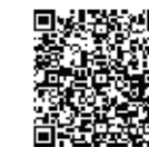
▲瑞穂町ウェブサイト

問合せ・予約 羽村市以外の自治体での接種を希望する場合は、11月1日(水)から、各コールセンターで電話予約ができます（福生市保健センターは予約不要）。