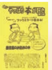
▲やっぱり本が 好き

今年の秋は、新しい本だけではなく、古い本も意識的に手に取ってみたいはかがでしょうか。