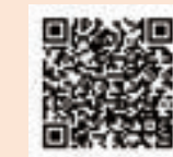
▲メールマガジンは こちら

現在は、メールマガジンという形で、毎週金曜日に図書館員のコラム、図書館のイベントや、新着図書情報などをお届けしています。ぜひ、登録して読んでみてください。