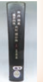
▲第 1 号の本 「日本文学全集 1」