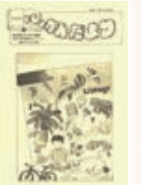
▲としょかん だより