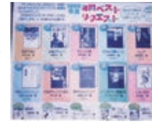
▲写真は 1999 年の ベストリクエスト

その年にリクエストが多かった本の上位 20 位を紹介するベストリクエスト。平成 5 (1993) 年と、令和 5 (2023) 年のベストリクエスト (一般書) の、上位 3 位を比べてみました。並んだ本のタイトルを見ると、当時のことが思い出されませんか。