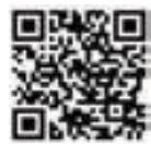
▲青梅佐藤財団特設サイト