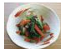
▲ほうれん草と根菜の味噌サラダ