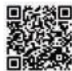
▲高齢者インフルエンザ予防接種について

②60歳以上65歳未満で、心臓・じん臓または呼吸器の機能に自己の日常生活が極度に制限される程度の障害を有する方および、ヒト免疫不全ウイルスにより、日常生活がほとんど不可能な程度の免疫機能の障害がある方（障害者手帳1級相当）