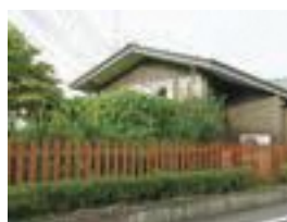
▲事業者（団体）の部 まつぼっくり保育園