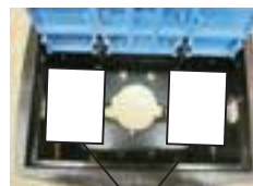
毛布などで防寒対策を！

冬は凍結による給水管の破損やメーターの故障が起こりやすくなります。屋外の蛇口などに、毛布を巻く、メーターボックスの中に発砲スチロールを入れたりするなど、凍結対策をしてください。