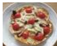
▲フライパン de ピザ