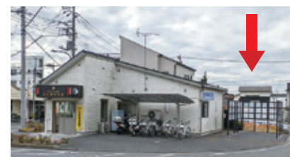
▲羽村駅西口の新しい指定喫煙場所