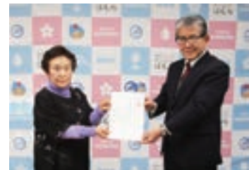
▲桑原会長(左)と橋本市長