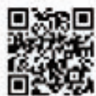
▲税理士による無料相談(青梅)ウェブサイト

■ 電話 ：1月10日(水)～2月6日(火)の午前9時～午後4時(土・日曜日を除