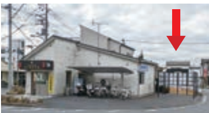
▲羽村駅西口の新しい指定喫煙場所

市では「羽村市ポイ捨て及び飼い犬のふんの放置の禁止並びに路上喫煙の制限に関する条例」を定め、健康で安心して暮らせるまちを目指しています。みなでマナーを守り、健康で安心して生活できる羽村をつくりましょう。 問合せ 環境保全課☎224