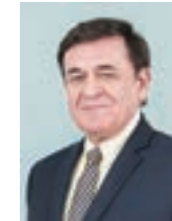
▲ケント・ギルバートさん

日本の財政、食料、エネルギーなどの重要な課題や、他国との外交問題を踏まえ、今後の日本のあり方を一人一人が自ら考えるように提案します。日本人として今何をすべきか、日本が大好きなケント・ギルバートさんが話します。