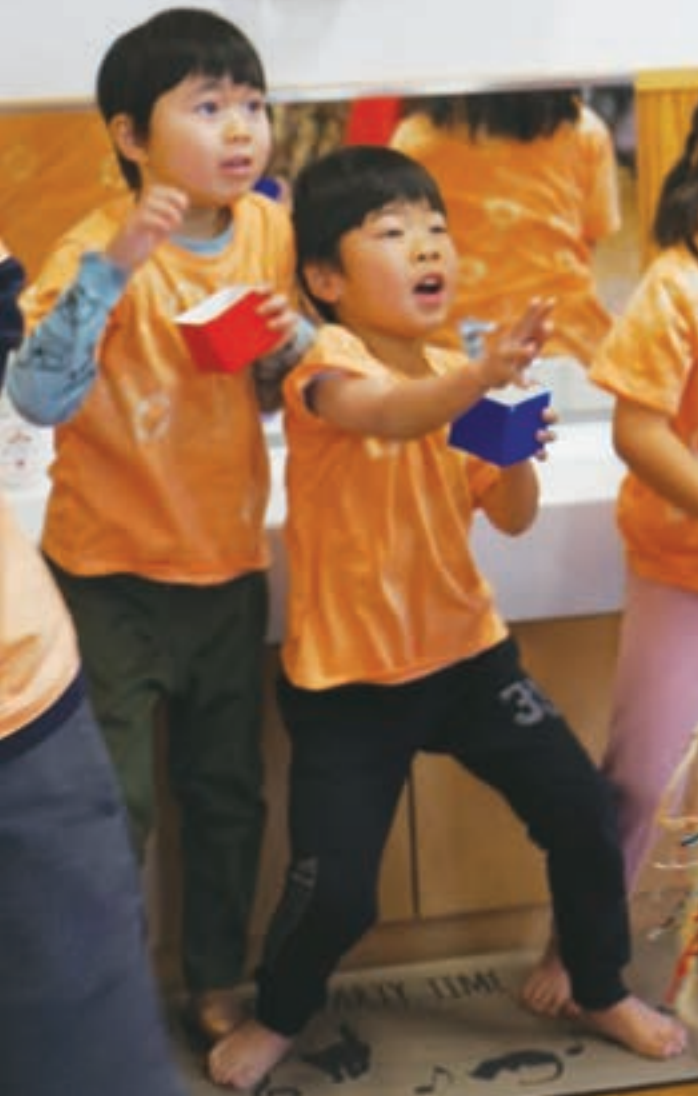
市内保育園での豆まきの様子。 勇気を出してみんなで 鬼を追い払ったりん♪ (2月2日撮影)

URL = https://www.city.hamura.tokyo.jp/ cs102000@city.hamura.tokyo.jp 〒205-8601 東京都羽村市緑ヶ丘5-2-1 ☎042-555-1111 ⑨336 FAX 042-554-2921