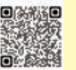
▲デジタル庁ウェブサイト

※マイナポータルを通じて転出届を提出した後は、別途、転入先市区町村の窓口で転入などの手続きが必要です。