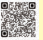
▲引っ越し手続きについて

マイナンバーカードのある方は、マイナポータルからも転出の届け出が可能です。また、スマートフォン用電子証明書搭載サービス対応端末を持っている方は、スマートフォンのみで手続きできます。詳しくはデジタル庁ウェブサイトを確認してください。