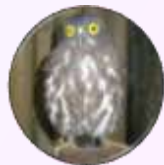
市の鳥 「アオバズク」

人口：54,609人 ※うち外国人1,402人（2.6%） 世帯：26,016世帯 ※うち外国人世帯670世帯（2.6%） 人口密度：5,516人/km 2 面積：9.90km 2