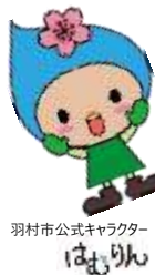
羽村市公式キャラクター はむりん

(*) 令和2年度羽村市市政世論調査 ※羽村市の魅力・羽村らしさを感じる施設や行事 トップ3