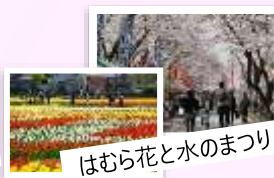
はむら花と水のまつり

(*) 令和2年度羽村市市政世論調査 ※羽村市の魅力・羽村らしさを感じる施設や行事 トップ3