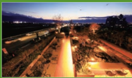
▲シャトレゼホテル旅館富士野屋 テラス