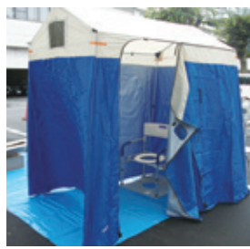
▲市役所第2駐車場の汚水樹を利用した仮設トイレ

建設改良工事などの状況 下水道施設長寿命化対策として、汚水管のテレビカメラ調査（1万2412m）や内面補修工事（154か所）を行いました。 災害時の衛生環境の向上とトイレ不足の解消のため、市役所の第2駐車場内に、災害時仮設トイレ用汚水樹を設置する工事を行いました。