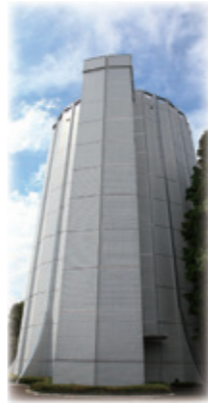
水道事業の決算報告

令和5年度の水道事業収益は、9億9035万円で、令和4年度と比べて947万円減少しました。 水道使用量は570万5452m 3 で、令和4年度と比べて5万8895m 3 減少しました。 水道事業費用は、7億9831万円で、令和4年度と比べて4711万円減少し、純利益は1億9204万円の黒字決算となりました。