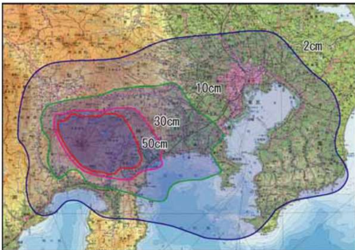
降灰予想図（降灰の影響がおよぶ可能性の高い範囲）