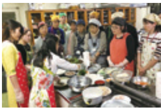
▲過去の文化講座の様子