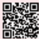
▲ごじょ互助トーク会申込フォーム