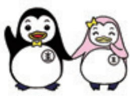
▲更生保護のマスコットキャラクター・更生ペンギンのホゴちゃんとサラちゃん