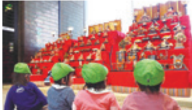
▲昨年度のひな人形展