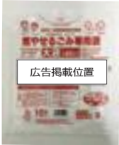
▲掲載の位置 (外袋 図2)