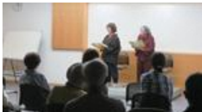
▲昨年9月のおはなし会の様子