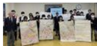
成果物とともに記念撮影▶

詳しくは、市公式サイトや各お知らせの二次元コードから確認するか、問い合わせてください。