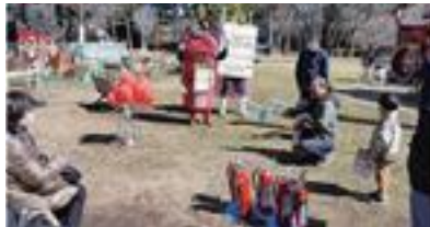
▲過去のイベントの様子