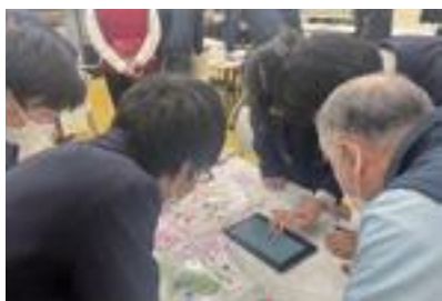
▲年齢や立場を超えて真剣に話し合いました