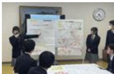
▲資料をまとめ、各グループの話し合いの成果を発表し、参加者全員で共有

東京都立羽村高等学校では、昨年12月20日、日本赤十字社から講師を招き、「羽村市の地図を活用した災害図上訓練(DIG)」を行いました。