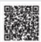
▲デジタル平和資料館(市公式サイト)

市公式サイトで郷土博物館収蔵の空襲関連資料などを公開しています。パソコンやスマートフォンなどで見ることが出来ます。