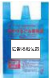
▲掲載の位置 (本体 図1)

②画像データ(JPEG、TIFF、PDFのいずれも1200dpi以上。モノクロ二階調)