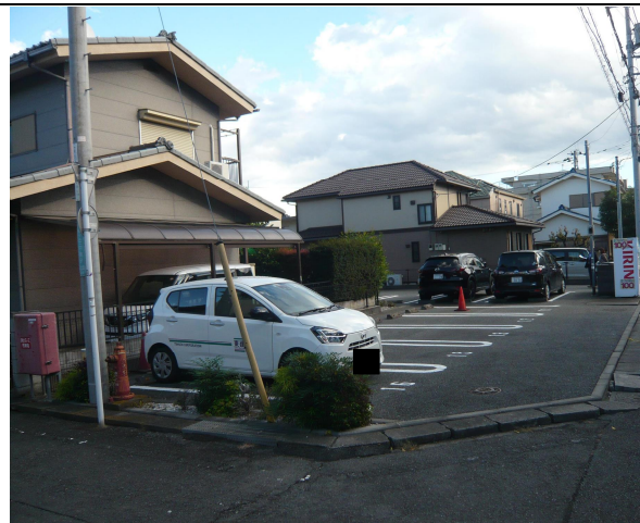
駐車場（北西側より撮影）