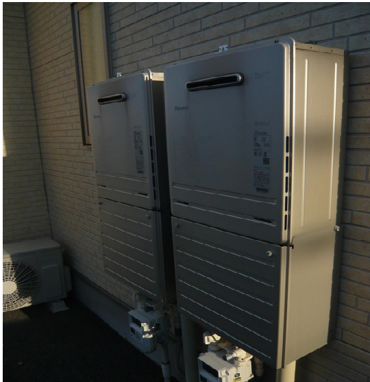
共同住宅設置給湯器