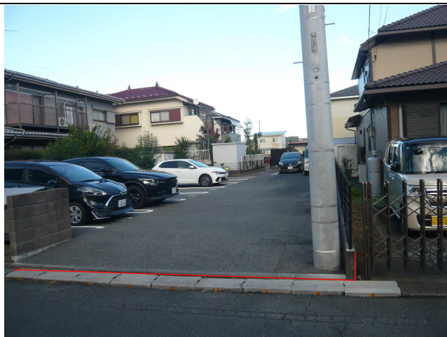
駐車場（西側から撮影）