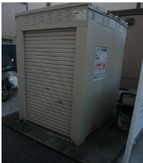
共同住宅西側設置ガス容器置場