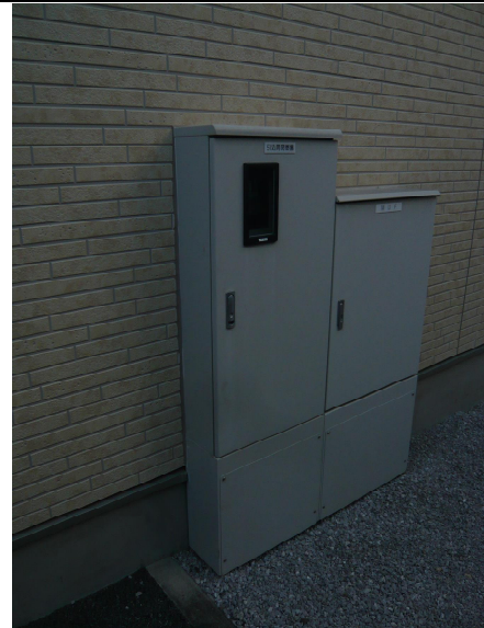
共同住宅設置開閉器盤