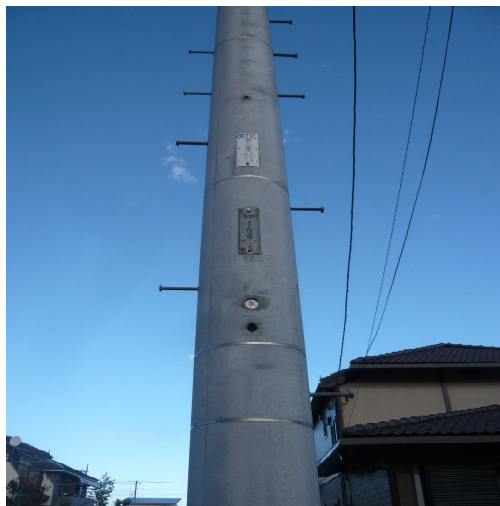
西側設置電柱（羽役169）