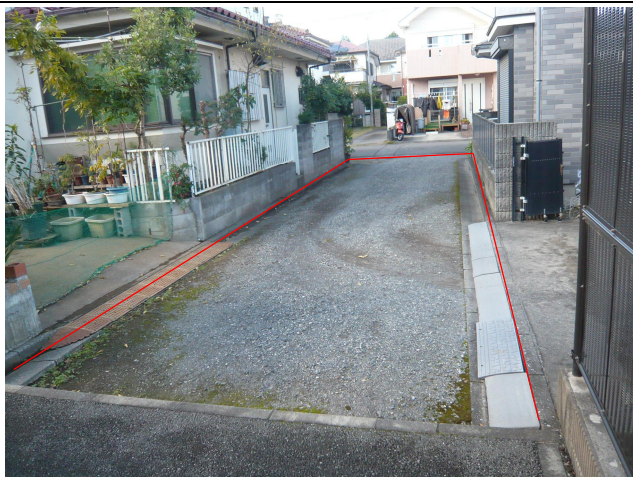
北西側未舗装私道