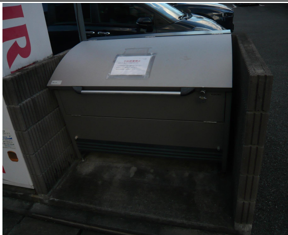
西側設置ゴミ集積所