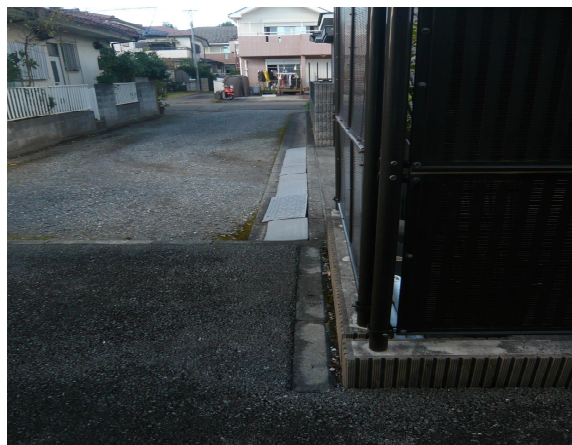
北西側未舗装敷地西側境界