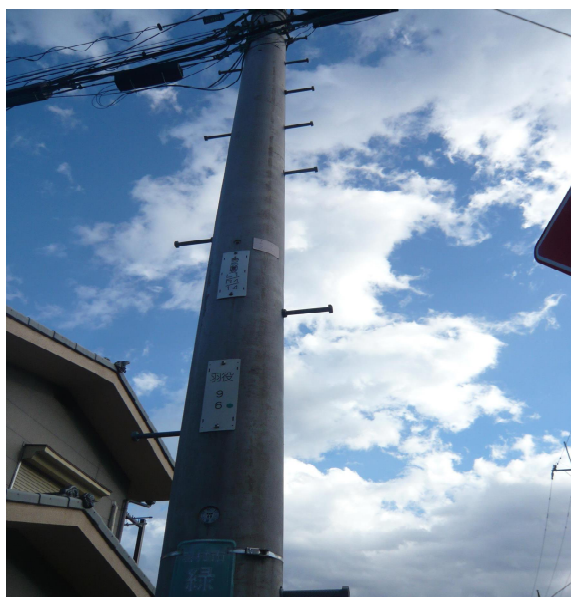
北西設置電柱（羽役 9 6）