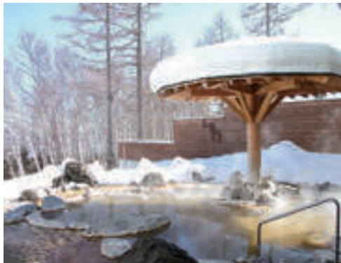
▲シャトレゼガトーキングダム小海

「温泉の温かさが染みる」「冬ゴルフは、空気が澄んで最高」「真っ白なゲレンデで心も身体もリセット」、市指定保養施設で「冬だからこそ…」を楽しんでみませんか。