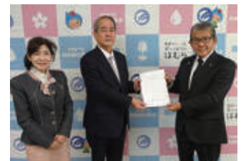
▲（左から）西川職務代理、関谷会長、橋本市長