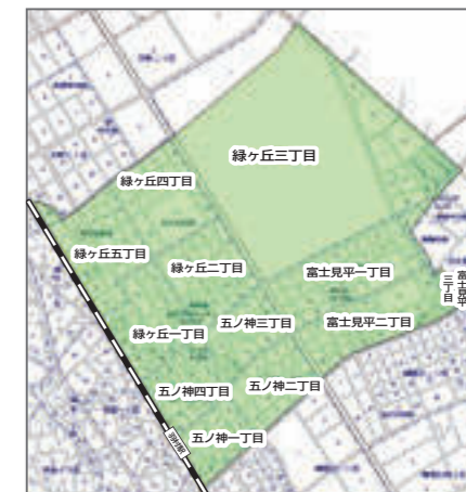
▲羽村富士見平土地区画整理事業の概要図

土地区画整理法では、できるだけ土地区画整理事業前の土地の位置や面積・土質・水利などの状況と同じになるように新しい土地(換地)を設計することを定めています。これを「照応の原則」といいます。完全に同じにすることは難しいので「原則」とされています。