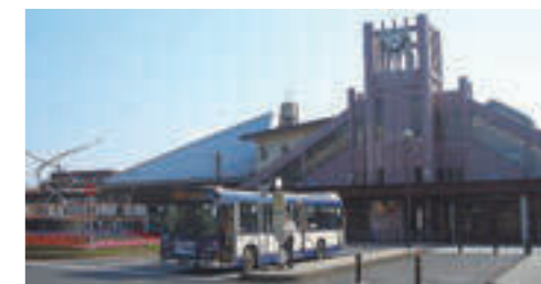
▲区画整理後の羽村駅周辺(現在)