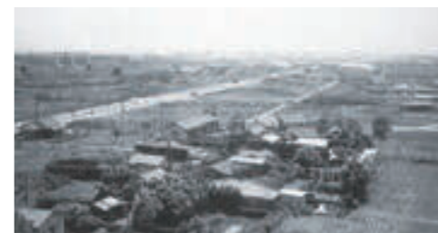
▲区画整理中の富士見平地区(昭和45年頃)