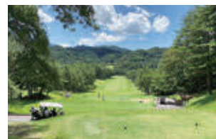
▲都留カントリー倶楽部