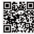
▲ウイングパーク 公式 Instagram