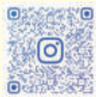
▲ポットラック 公式 Instagram