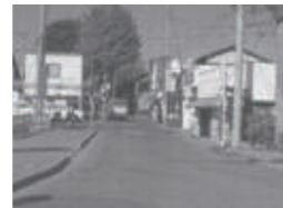
▲区画整理前の小作駅前