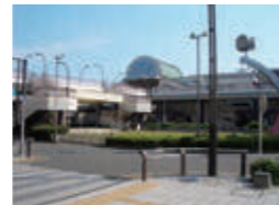
▲区画整理後の小作駅（現在）